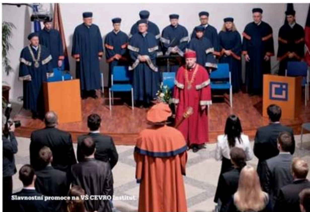
Slavnostní promoce na VŠ CEVRO Institut.

Příběh CEVRO Institutu se začal psát roku 2006. Myšlenkou bylo založit školu, která se bude věnovat naprosto specifickým a vysoce specializovaným oborům. Studentům nabídne plnohodnotný vzdělávací systém garantovaný nejlepšími pedagogy z řad osobností, které v rámci svých profesí významně zasáhly do fungování celého našeho státu. Za deset let své existence se může CEVRO Institut pochlubit více než tisícovkou kvalitních absolventů, z nichž mnozí úspěšně působí v podnikatelském sektoru i ve veřejné sféře, na politické scéně, v médiích, advokátních kancelářích i v bezpečnostních složkách.